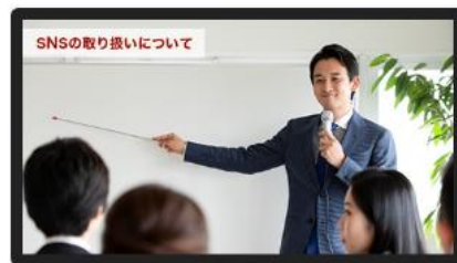
※集合研修動画 画面イメージ