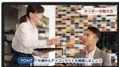
※接客マニュアル動画 画面イメージ