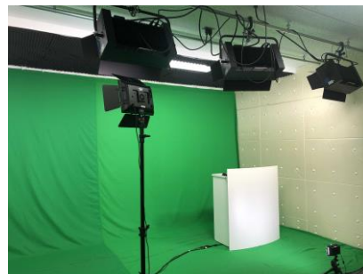
※当社バーチャルスタジオ（東京都千代田区）

「AirCourse」( https://aircourse.com/ )は、企業向け社員教育eラーニングサービスです。研修・教育にニーズの高いコースを揃えた“標準コース”と、企業がオリジナルで作成した動画を簡単に社内共有できる“オリジナルコース”があります。導入コストを抑え、低予算で運用できるほか、スマホ・PC・タブレットなどマルチデバイスに対応しています。実施履歴や成績などを一元管理出来るため、受講対象者に確実に受講してもらいたい研修などにも最適です。