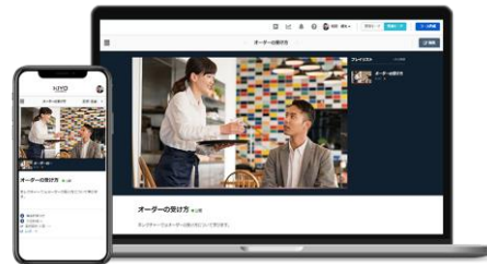
※制作した動画の配信イメージ